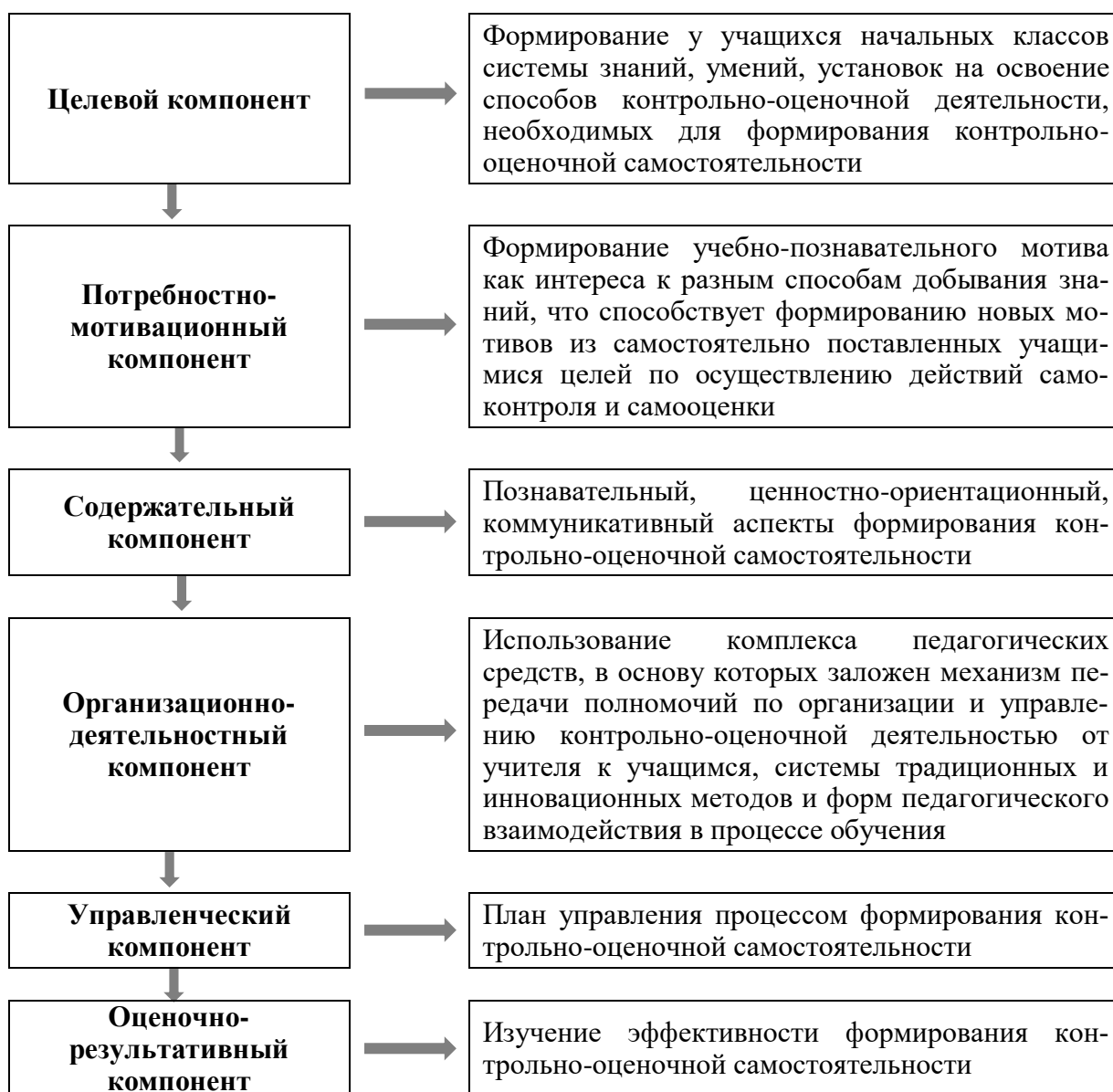
Рисунок 4 – Теоретическая модель формирования КОС (по Е.В. Проницовой [33; 43])

Теоретическая модель формирования КОС, изображенная на рисунке 4, состоит из следующих компонентов: