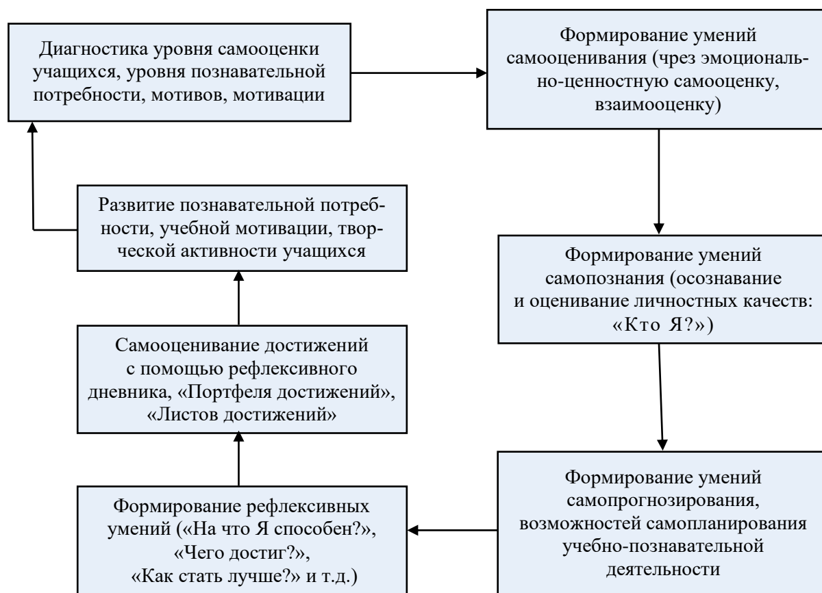
Рисунок 1 – Технологическая цепочка процесса формирования умений оценочной деятельности учащихся (Автор О.И. Баранова [2; 38])

А.И. Должикова определила следующую логику формирования КОС: ретроспективный, процессуальный, прогностический самоконтроль и самооценка [34].